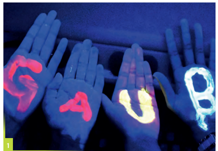
Abbildung 1 In der Gauß-AG arbeiten Schülerinnen und Schüler in Kleingruppen an ihrem eigenen Projekt.

Der Fokus liegt hierbei auf der Erzeugung von Strom durch Windkraft und die Funktionsweise eines Elektromotors. Interessierte Schülerinnen und Schüler können in der Gauß-AG Energiegewinnung eine Woche lang selbst ausprobieren, experimentieren und diskutieren. Anhand von Aufgaben und Fragestellungen üben sie das wissenschaftliche Arbeiten und tüfteln in Kleingruppen an ihren eigenen Projekten. Pro Ferienkurs werden in der Regel vier verschiedene AGs angeboten. Betreut werden die Teilnehmenden dabei von studentischen Tutorinnen und Tutoren.