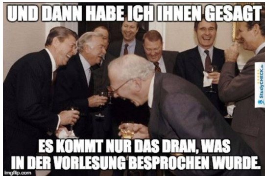
Abbildung 2: Laughing men in suits.

und mit Gläsern in der Hand, die – abhängig von ihrer Position im Vorder- oder Hintergrund des Bildes – von Kopf bis Hüfte bzw. Oberschenkel abgebildet sind. Diese häufig zur Abbildung von Dialogszenen eingesetzte amerikanische bzw. halbnaher Einstellung (Korte 2010: