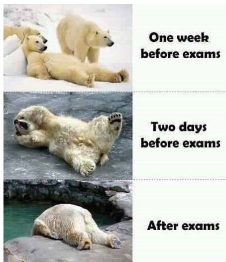
Abbildung 4: Eisbären.

Bild 1 zeigt in der Halbtotale einen auf dem Eis entspannt auf dem Rücken liegenden Eisbären, neben dem ein weiterer Bär steht. Rechts neben dem Foto ist der Text [One week before exams] in fetter, schwarzer Schrift in einem quadratischen Textkasten angeordnet. Gemäß der in westlichen Ländern konventionalisierten Leserichtung von oben links nach unten rechts wird somit – nach der holistischen Wahrnehmung des Bild-Makros (vgl. Schmitz 2011) – zuerst