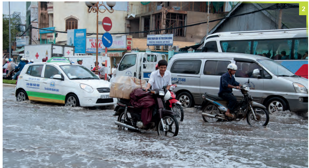
Abbildung 2 Überflutung von Straßen im Bezirk Binh Tan, HCMC, Vietnam.

Obwohl die lokale Wirtschaft und der Lebensstandard seit vielen Jahrzehnten prosperie-