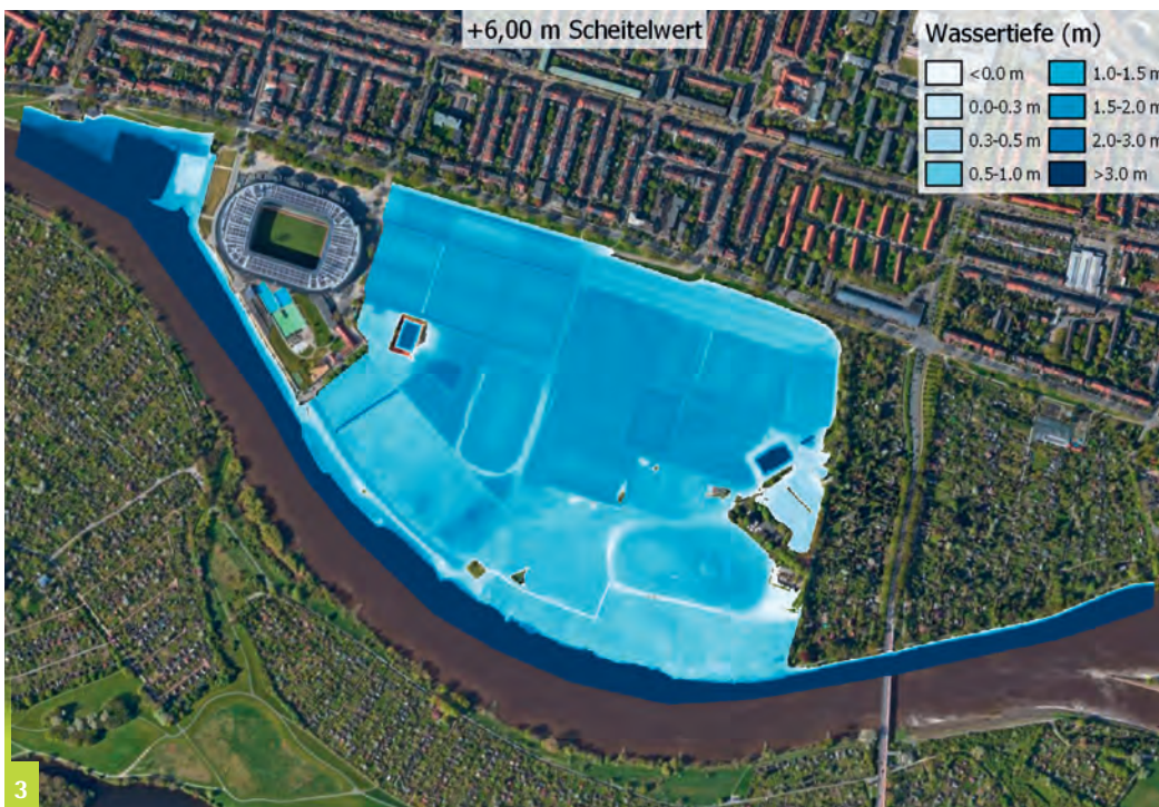
Abbildung 3 Satellitenaufnahme der Pauliner Marsch mit den mithilfe der Software HEC-RAS errechneten maximalen Wassertiefen nach einer schweren Sturmflut mit 6,00 m Höchstwasserstand.

Entscheidungsträger*innen suchen daher schon heute nach Lösungsansätzen, welche zusätzliche Nutzungsmöglichkeiten bieten. Sowohl „graue“ als auch „grüne“ Anpassungsstrategien sollten zudem das Ziel haben, auch in Zukunft möglichst wenig Bedauern