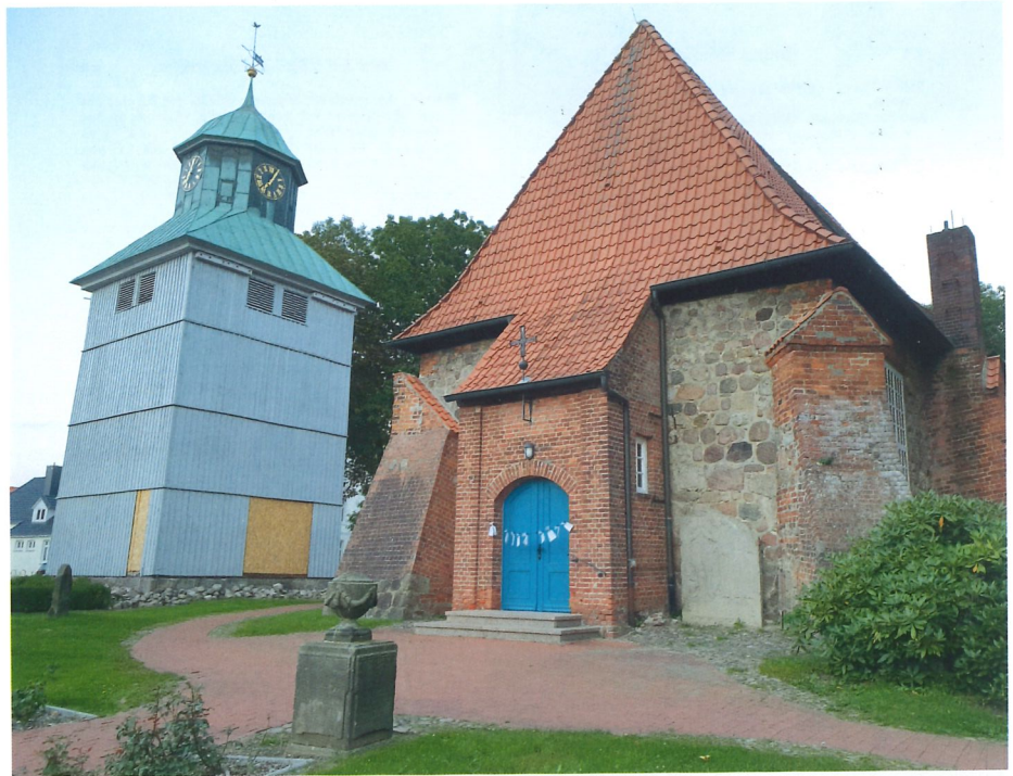
Grabstein Henrich Papes vor dem Westportal der Ev.-luth. St. Johannis-Kirche zu Visselhövede (Fotos 1-3: Lütjen).

Henrich Pape wurde am 9. März 1745 in Bremen geboren und starb am 18. April 1805 in Visselhövede. Nach dem Besuch von Domschule