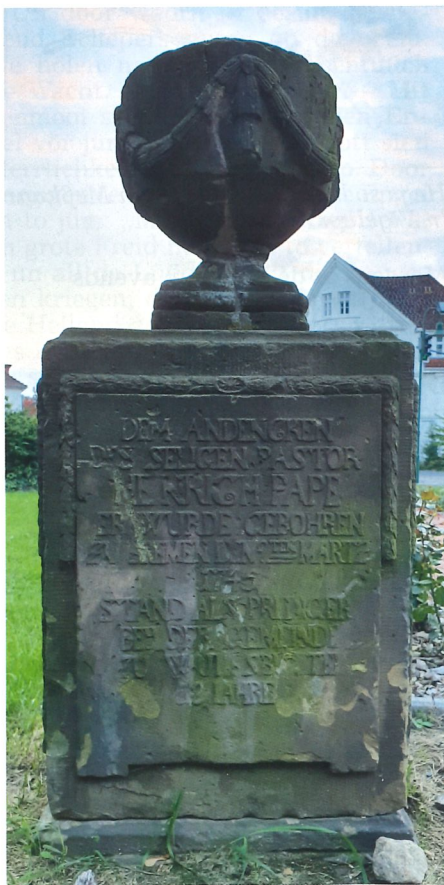
DEM ANDENKEN DES SELIGEN PASTOR HENRICH PAPE ER WURDE GEBOHREN ZU BREMEN DEN 9TEN MARTE 1745 STAND ALS PREDIGER BEY DER GEMEINDE ZU WULSBÜTTEL 12 JAHRE

Dieses im Internet gefundene Zitat galt es anschließend mit Hilfe einer seriöseren Quelle zu verifizieren. Der Eintrag in der Berliner ZDB gibt darüber Auskunft, dass die Bayerische Staatsbibliothek München (BSB) ihren von 1770 bis 1802 vorhandenen Bestand der Zeitschrift „Journal für Prediger“ retrodigitalisiert hat und im Rahmen bundesweiter Absprachen auch für die Digitale Langzeitarchivierung (LZA) verantwortlich zeichnet. Die bei Google ermittelte Quelle konnte dadurch im Katalog der BSB verifiziert werden. 4