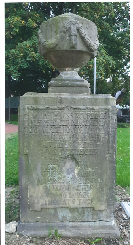
IM JAHRE 1783 WURDE ER ALS PREDIGER DER GEMEINDE ZU VISSELHOVEDE BESTELLT DERSELBEN 22 JAHRE MIT ALLER TREUE UND SEEGENREICHEN (...) AM 18TEN APRIL 1805 IN EINEM ALTER VON 60 JAHREN 1 MONAT 9 TAGE