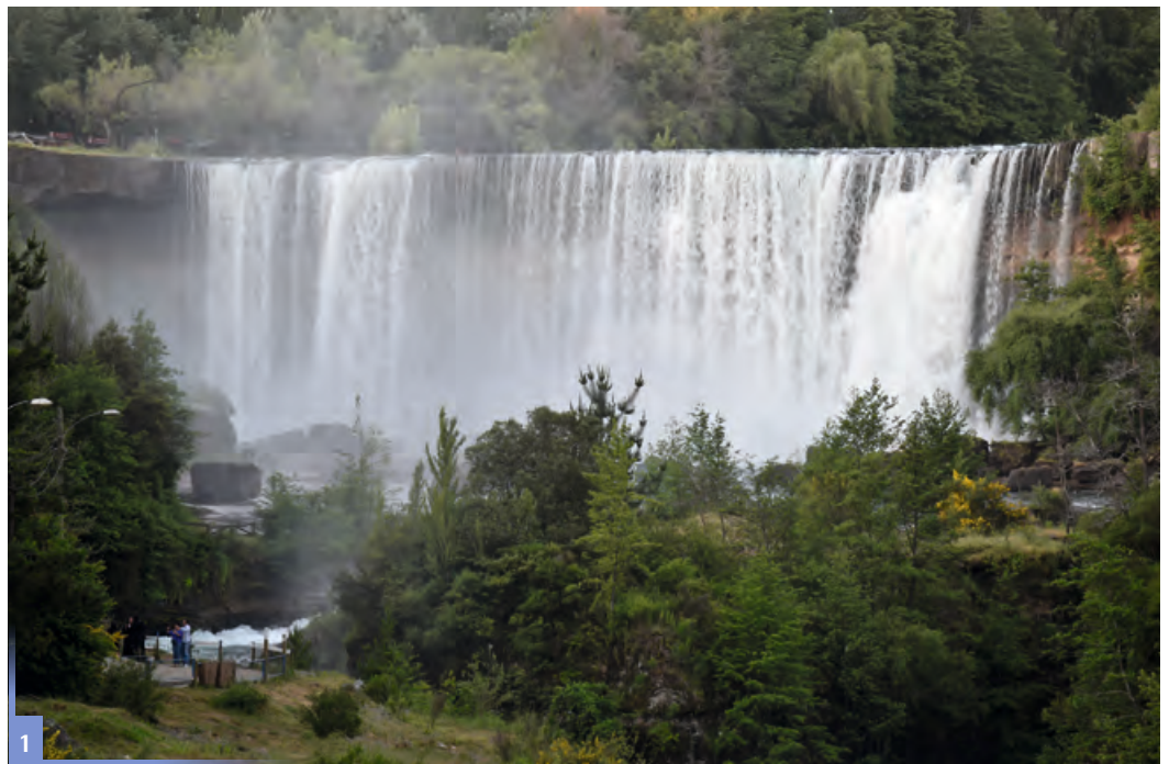
Abbildung 1 Der Laja-Wasserfall in Chile ist nicht nur eine touristische Attraktion, sondern er hängt stark von der Steuerung der Wasserkraftwerke und von der Ausleitung von Bewässerungswasser im Oberlauf ab. Die integrierte Bewirtschaftung der Wasserressourcen im Einzugsgebiet ist daher eine komplexe Fragestellung, welche vertiefte quantitative Analysen und die Einbeziehung der Wassernutzer erfordert.

Wasser ist eine unverzichtbare Ressource für die nachhaltige Entwicklung der Menschheit: Zum Beispiel bei der Versorgung der wachsenden Bevölkerung mit Nahrungsmitteln (Bewässerungslandwirtschaft), bei der Nutzung regenerativer Energien (Wasserkraft) und bei der Anpassung an den Klimawandel. Eine funktionierende Wasserversorgung kann aber auch die UN-Entwicklungsziele zu Bildung und Geschlechtergerechtigkeit unterstützen, da in einigen Regionen der Welt die häusliche Wasserversorgung derart abläuft, dass Frauen und Mädchen das Wasser kilometerweit herbeiholen