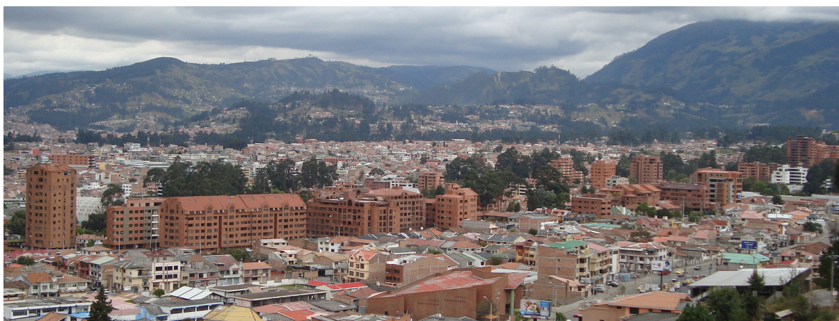
Figura 1. Gringolandia a principio de los 2010.